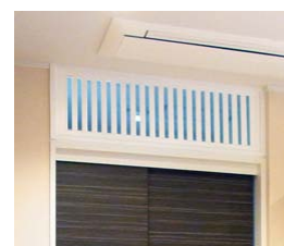
建具を閉めたまま、 換気が可能な欄間 (西村工務店オリジナル)