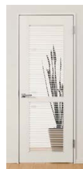
採光採風可能な 室内ドア